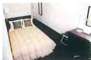
セミダブルルーム