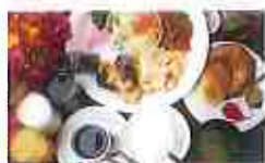
朝食バイキング(有料)