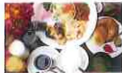
朝食バイキング(有料)