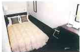
セミダブルルーム