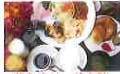
朝食バイキング(有料)