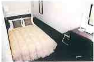
セミダブルルーム